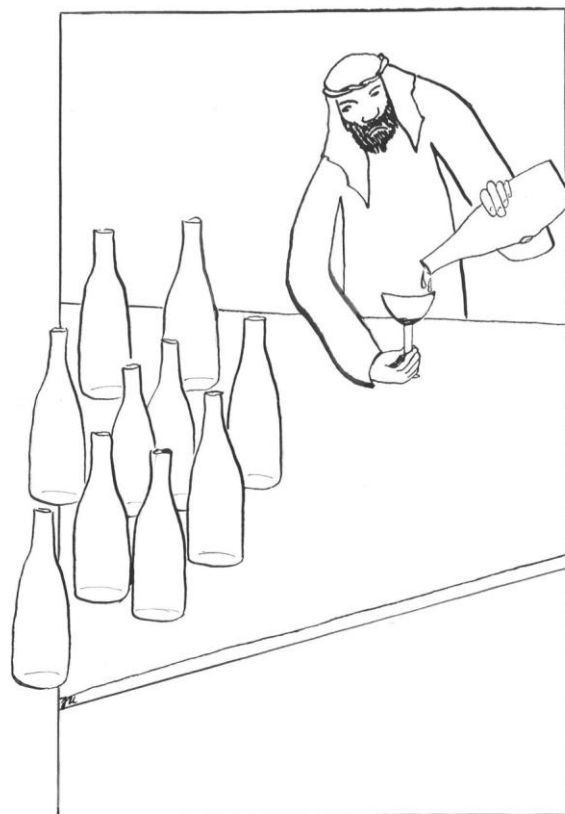
2. neděle v mezidobí cyklu C Jan 2,1-12