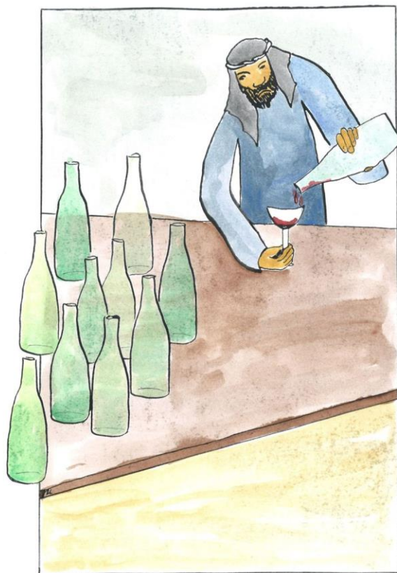
2. neděle v mezidobí cyklu C Jan 2,1-12