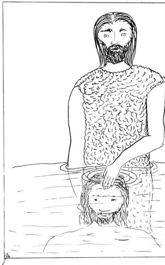
Svátek Křtu Páně C Lk 3,15-16.21-22