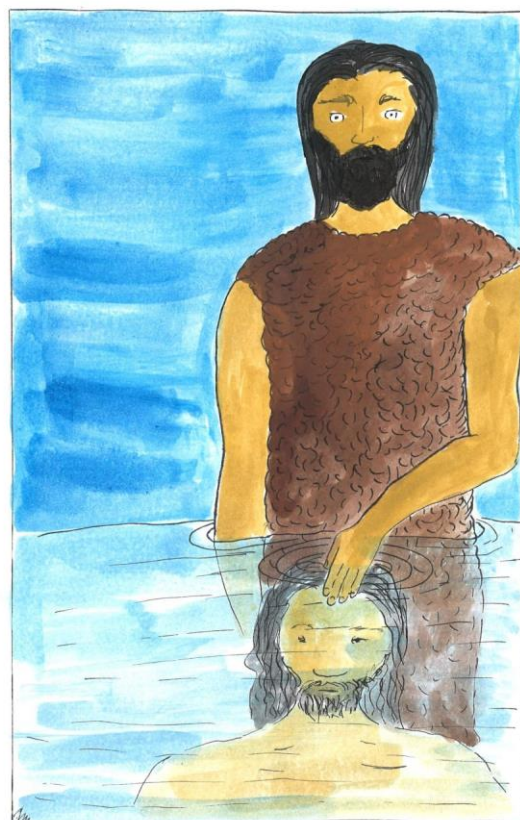
Svátek Křtu Páně C Lk 3,15-16.21-22