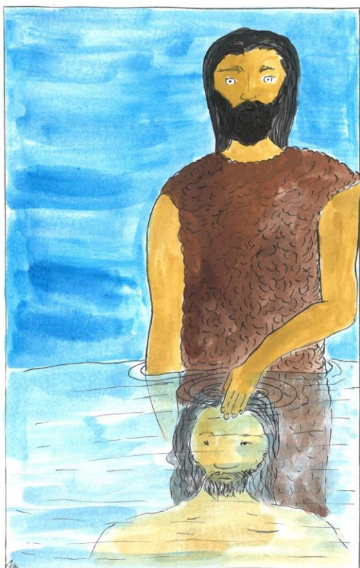
Svátek Křtu Páně C Lk 3,15-16.21-22