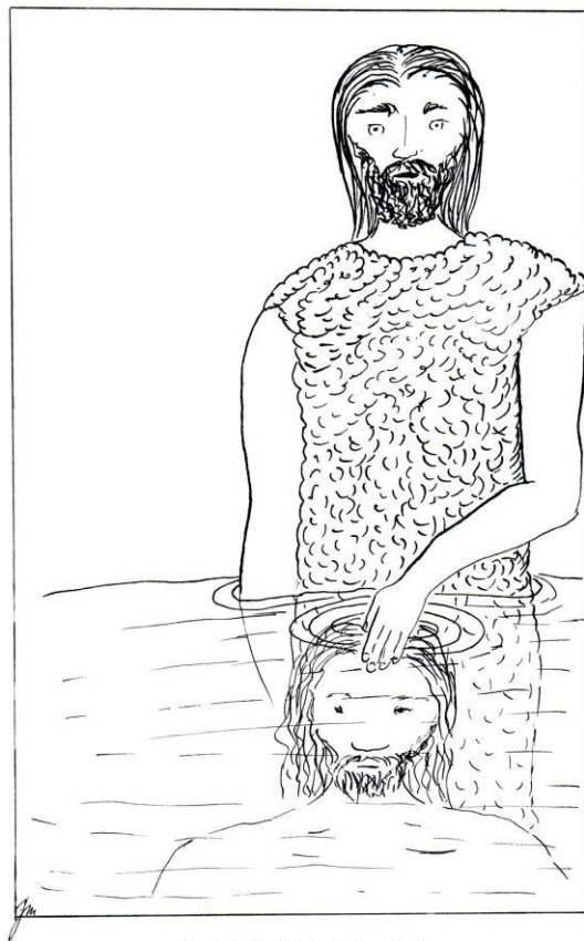
Svátek Křtu Páně C Lk 3,15-16.21-22