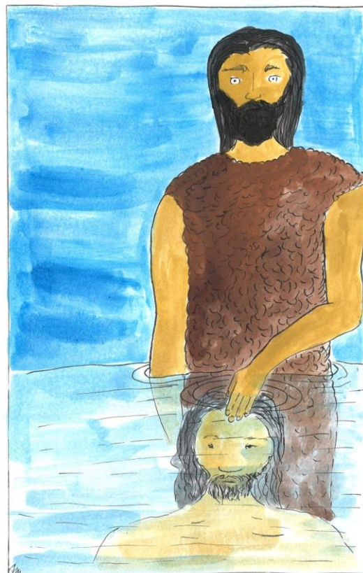
Svátek Křtu Páně C Lk 3,15-16.21-22