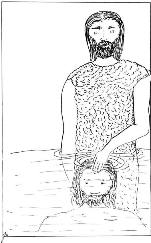
Svátek Křtu Páně C Lk 3,15-16.21-22