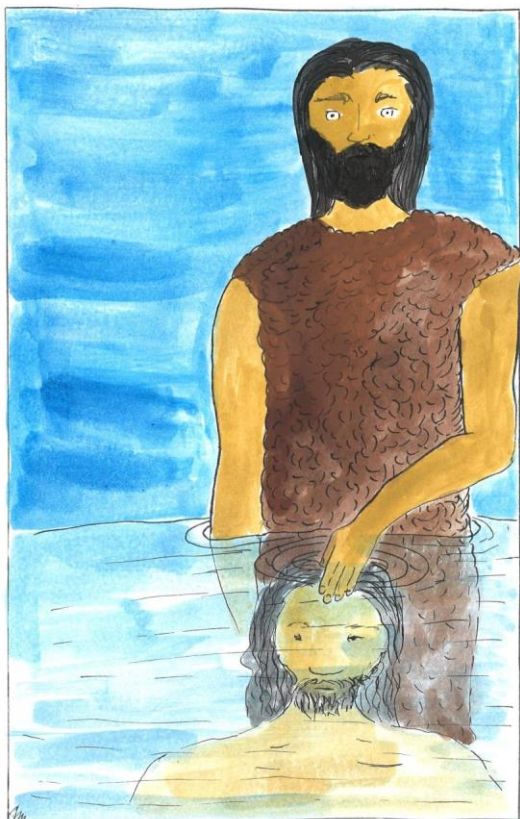
Svátek Křtu Páně C Lk 3,15-16.21-22