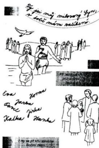
17. Ježíšův křest