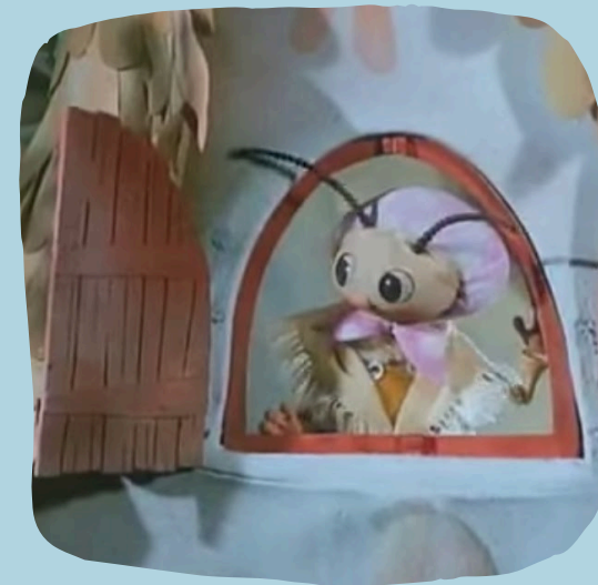
Maminka včelích medvídků

Bud' opatrný, když něco děláš a řekni si, když něco potřebuješ.