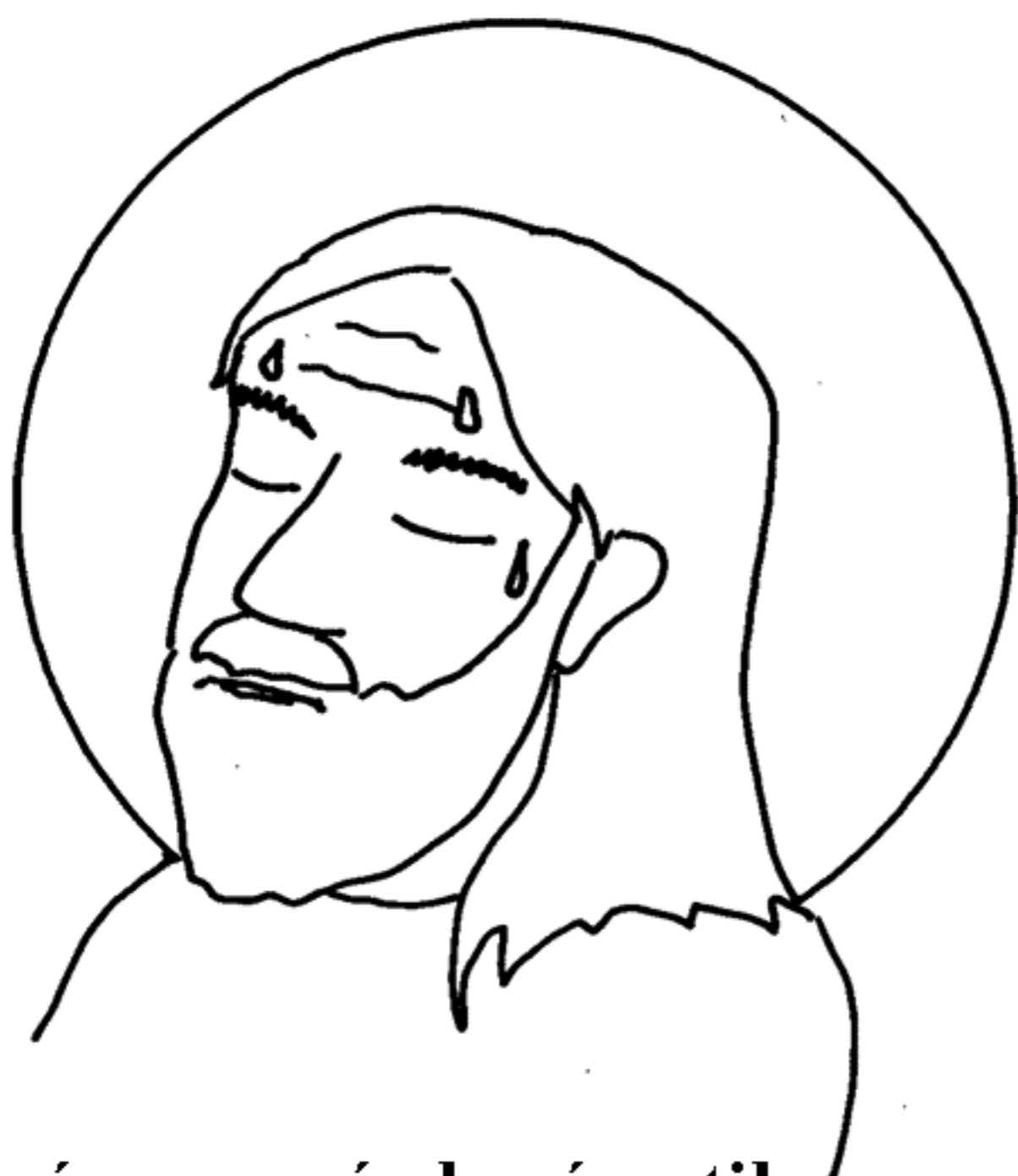
... který se za nás krví potil