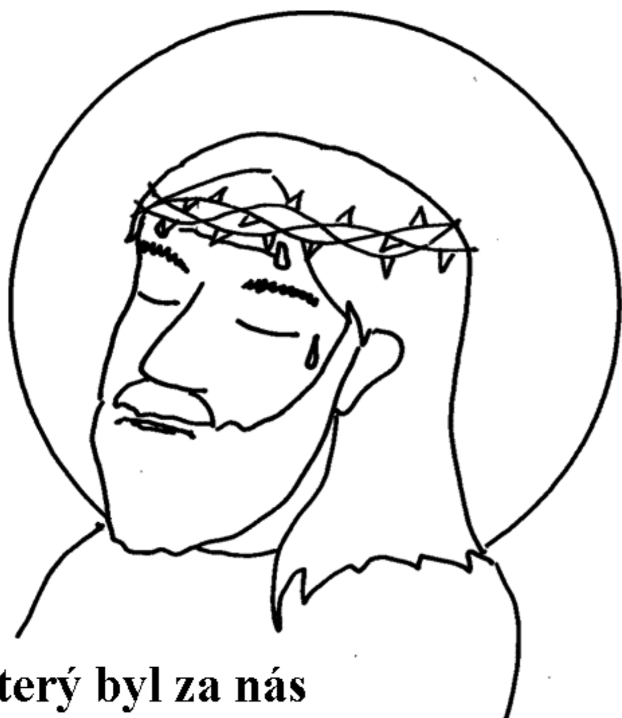
... který byl za nás trním korunován