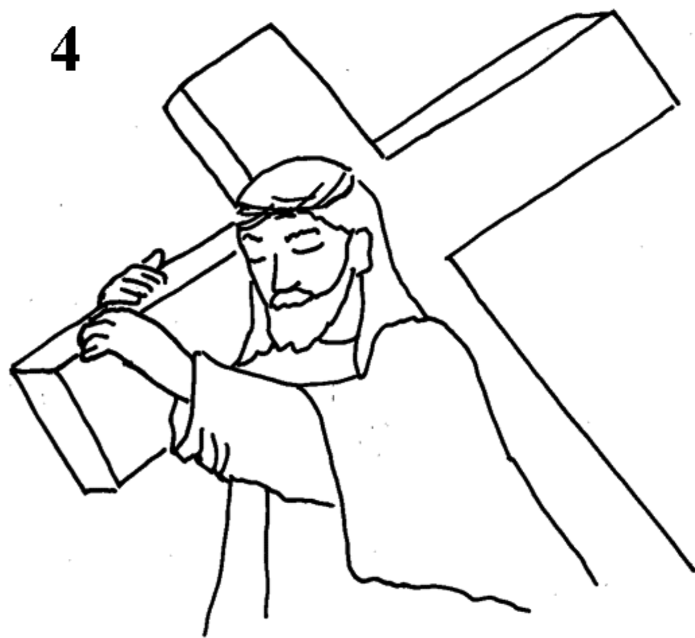
... který za nás nesl těžký kříž