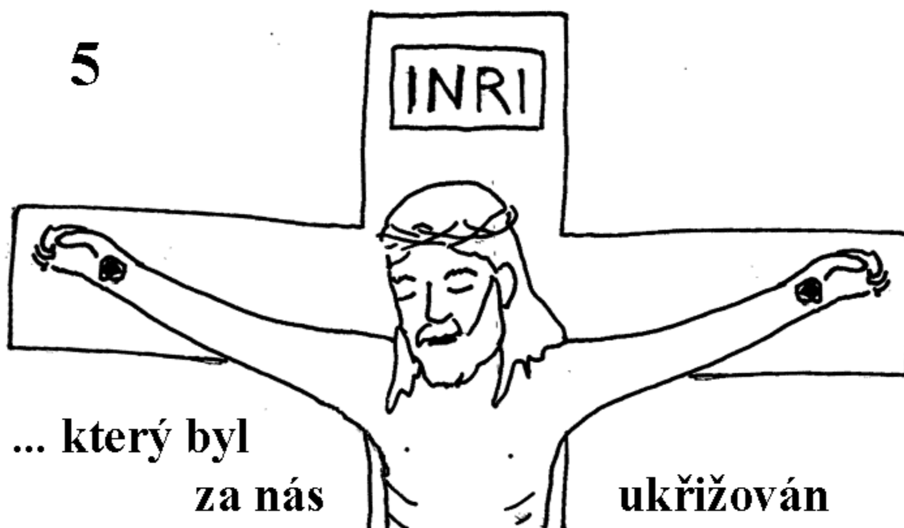
... který byl za nás